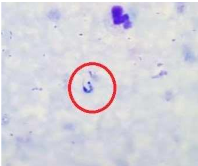
Imagen1. Imagen gota gruesa positiva para Trypanosoma sp caso Chagas agudo Rio Iró-Chocó

En el laboratorio de parasitología del INS se realiza verificación diagnóstica de la lámina inicial realizada en Rio Iró donde se confirma Trypanosoma sp. Imagen1.