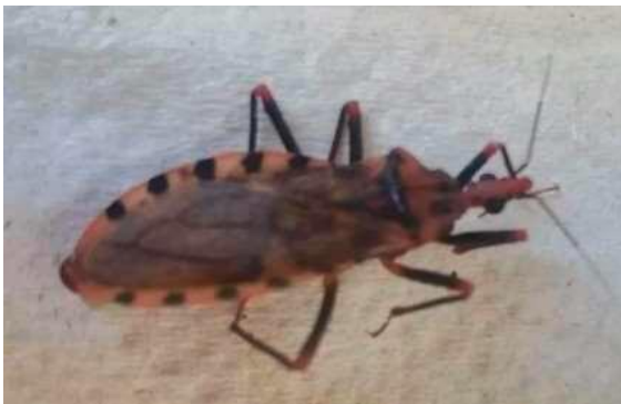
Imagen 2. Ejemplar adulto de Pastrongylus geniculatus encontrado por la comunidad

Como resultado de las actividades, no se encontró presencia de vectores domiciliados; sin embargo, a través de la estrategia de socialización de la enfermedad en la comunidad, se colectó un ejemplar de la especie Panstrongylus geniculatus el cual resultó negativo para presencia de Trypanosoma sp. por prueba directa (Imagen 2).