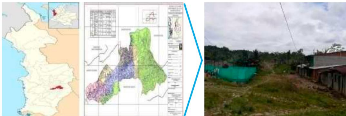
Mapa 1. Ubicación geográfica, municipio de Rio Iró-Chocó